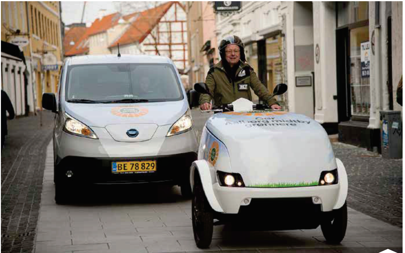
Pilotprojektet Flexskrald er med til at fremme en mere miljømæssig håndtering af affaldet fra Aalborgs erhvervsdrivende.